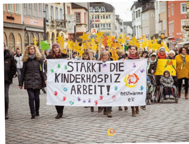
Walk of Care 2020

www.padlet.com/nataliekrieger1/walkofcare